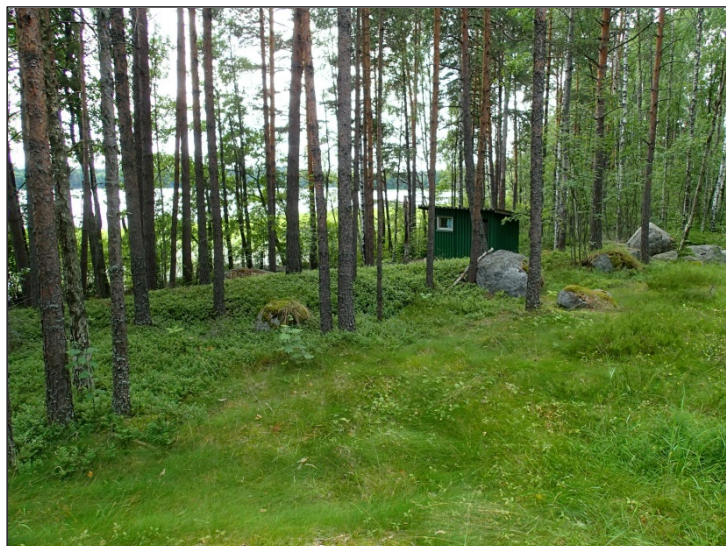
Vanha rantavalli alueen itärannalla.